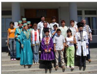
Яшкөлдің көп салалы гимназияның оқушылары-ақбөкен питомнигінің достары.