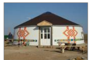
«Яшкель» ақбөкен питомнигі территориясындағы келушілерге арналған жаңа Орталық.

2005 ж. июнь айының 22-і күні АҚШ-тың балық және құстар жөніндегі ұйымы «Черные земли» биосфералық қорығының қызметкерлерін радиостанциямен және басқа да құрал-жабдықтармен қамтамасыз ету үшін 23400 доллар қаржылай көмек көрсететін жария етті. Қорық шекараларына арнаулы белгі қою және Яшкель ауданындағы (Қалмақия) ақбөкен питомнигі территориясындағы келушілерге арналған Орталық құрылысын салуға аздап қаржы бөледі. Толығырақ сайтта http://usembassy.ru/embassy/releaser.php?record_id=48