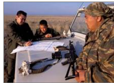
Инспекторлар тобы. Сурет Дж.-Ф. Лагротанікі