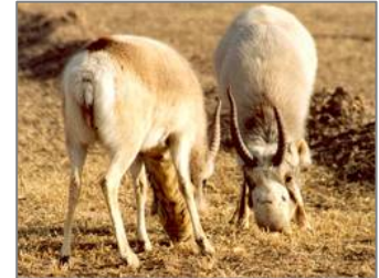
Ақбөкен текелерінің тіресі. Ганьсудегі аңдарды өсіру Орталығы (Қытай).

Ақбөкен қолда өсіруді ғылыми зерттеу 1988-1993 және 2001-2003 жылдары жүргізілді. Тіршілік ету ерешеліктері, мінез-құлқы, күйге түсу кезіндегі текелерінің мінез-құлқы мен аналықтарының екіқабат және туу кезіндегі әрекеттері зерттелген (Tan et al. 1994a, 1994b, 1994c, Kang et al. 2001). Бұл уақытта ақбөкендер мөлшері 23x30 м болатын торлы қорада ұсталды, сонда оларды азықтандырды. 1992 ж. торлы қораның көлемін 27 гектарға дейін кеңейтті; соған байланысты аңдар еркін жайылатын болды. 2004 жылдың қысына дейін онда 29 ақбөкен өмір сүрді. 2005 ж. май айында тағы да 16 ақбөкен құралайы тұды. Сонымен, ондағы ақбөкеннің жалпы саны 40-тан асты. Алдағы бірнеше жыл ішіндегі Орталықтың ақбөкенді қолда өсірудегі негізгі бағыттары мыналар: аңының санын өсіру, генетикалық мониторинг жүргізу, қолда туған ақбөкендердің көбеюін зерттеу. Орталық әртүрлі мәліметтермен алмасу және материалдық-техникалық базаны жақсарту үшін түрлі ғылыми және табиғат қорғау ұйымдарымен байланысты күшейтуге тиіс. Қосымша мәліметтерді Аили Каннан (Aili Kang) аласыздар: yqling@online.sh.cn