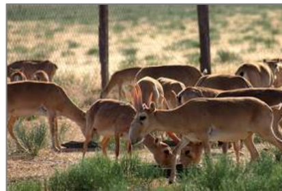
Ақбөкендер төлдеу кезінде питомникте минералдық қоспалар, витаминдер, құнарландырылған азықтар алады.