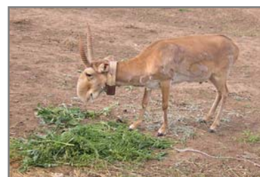
Мойнына радиоөшейник кигізілген ақбөкеннің текесі.

2004-2005 жылдары Қалмақ Республикасының жабайы жануарлар Орталығы Мэдисон университеті (штат Висконсин) және Чикаго зоологиялық қоғамымен бірлесе отырып, қолда өсірілген 5 ақбөкен текесін жердің жасанды серігі арқылы және жерден бақылайтын шағын экспериментальды проектiнi жүзеге асырды. Мойындарында радиоқабылдағыштар бар жануарлар табиғатқа жіберілген. Проектiнiң мақсаты – қолда өсіріліп, кең далаға бос жіберілген ақбөкендердің ортаға бейімделуін және олардың қоныс аударуын бақылау. Жіберілген ақбөкендер өздері мекендейтін жерлерде басқа ақбөкендер тобына қосылып, күйге түсуге қатысқан. Күйге түскеннен кейін олардың бірін қасқыр жеп қойған. Жүргізілген бақылауға қарағанда, осы ақбөкен текесі әртүрлі жастағы 17 ұлғашы ақбөкеннен өзіне топ (гарем) құрған. Қалған төрт теке әзірше тірі, олармен жердің жасанды серігі арқылы бақылау жүргізілуде. Қосымша мәліметтерді Орталық директоры Ю.Н.Арыловтан алуға болады: kalmsaigak@elista.ru