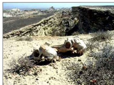
Ақбөкеннің мүйізі кесіліп алынған бас сүйегі. Үстірт

Адамдар үшін браконьерлік – ауыр жағдайда өмір сүрудің бір жолы. Аңшылық жасауға және алынған өнімдерге үкімет тарапынан бақылаудың жоқтығы жергілікті тұрғындардың осындай кәсіппен айналысуына мәжбір етті. Үстірттің әрбір елді мекенінде браконьерлердің «жұмыс істейтін» өз бригадалары бар. Қарақалпақия поселкесінде тұратындардың жүзден аса мотоциклдері бар.