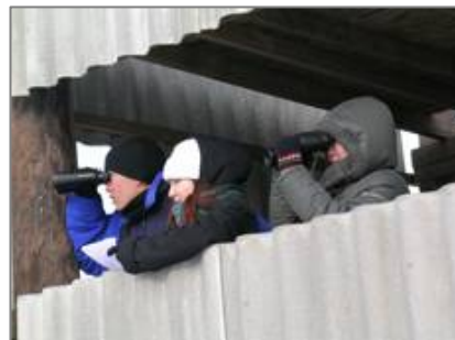
Қалмақтың мемлекеттік университеті биология факультетінің студенттері ақбөкеннің күйге түсу кезінде бақылау жүргізуде.