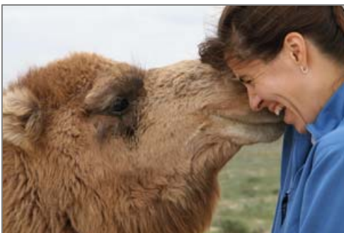
Сондай сүйініспеншілікпен Өзбекстанда түйемен кездесу.

Шексіз далада жолымызда ұзақ болды, тек әсем табиғатты фотосуреттерге түсіруге ғана тоқтадық. Жол бойында анда-санда ұсақ құстар, кеміргіштер, жайылып жатқан қой отарлары, сондай-ақ түйелер, аттар мен есектерде көзге түседі. Жолда жеген тамағыңның өзі де тәтті ғой. Жолда біз Самарканд, Бұқара және Нөкес қалаларына тоқтадық. Әр қала өзінің тарихы, мешіттері және әсем көркімен, көне дәуірдегі тіршілігімен суреттеледі ғой.