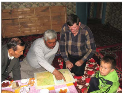
Жаслық поселкесінде сұрау өткізу.