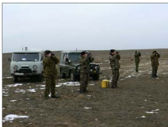
Қорықша қызметкерлері далада объектілерді қорғау үстінде.

Қорықша қызметкерлері осы міндеттермен қатар басқада міндеттерді орындау үшін жұмыс атқаруда. Қорықшада 10 адам қызмет етеді. Инспекторлар түнде көретін приборлармен, радиостанциямен, екі мотоциклмен («Кавасаки», «Ямаха»), қару-жарақпен, навигациялық прибормен, бинокльмен, экспедициялық құрал-жабдықтармен, видеокамерамен және фотоаппараттармен қалтамасыз етілген. Инспекторлармен құқықтық және басқа да мәселелер жөнінде тұрақты сабақтар өткізіліп тұрады; қару-жарақты және басқада арнаулы жабдықтарды пайдалану ережелерін сақтау жөнінде инспекторлардан зачет алынып отырады.