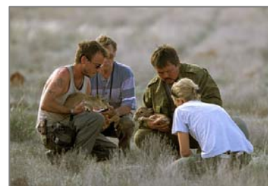
АСО командасының мүшелері Үстіртте ақбөкен лағын тексеруде.

Ақбөкенді сақтау Одағының мүшесі болып жеке адамдар немесе ұйымдар бола алады. Оларды Одаққа мүшелер ретінде тіркеп, АСО-ның ресурстық жүйелерін пайдалануды қалтамасыз етеміз. Мысалы, Одақтың мәліметтерін жіберіп тұрамыз. Біз Одақ мүшелерінің бізге қосылатына сенеміз және оларды ақбөкенді сақтау жөніндегі жобаларға қатысуға шақырамыз. Жобаларға, проектілерге қосылу АСО-ның эмблемасын пайдалануға, Одақтың вебсайтында өздерінің мәліметтерін беруге, «Saiga News» – нің "Проектілерге шолу" рубрикасында өз материалдарын жариялауға мүмкіндік береді.