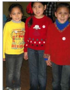
Астрахань балалар үйінде тәрбиеленушілер АСО значеын тағуда.

Бізде жобаларға қосылған программасы жасалған кіші гранттарды қолдау үшін қаржылар табуға күшімізді саламыз. Ақбөкенді сақтау Одағы (АСО-ның) мүшелерінің ролі және міндеттері, сондай-ақ АСО-ның әкімшілік құрылымы туралы мәліметтерді АСО сайтынан табасыздар немесе Басқарманың кез-келген мүшелерінен ала аласыздар.