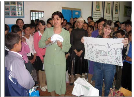
Қарақалпақия поселкасындағы № 26 мектепте ақбөкен жөніндегі үздік суреттерді таңдау конкурсының қортындысын шығаруда (сол жақта); №56 мектепте конкурс жеңімпаздарын марапаттау (оң жақта).