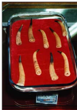
Қытай дәріханасында сатуға қойылған мүйіздер.

ИНТЕРФАКС хабарлағанындай, Қарағанда қаласының (Қазақстан) әкімшілік соты контрабандалық жолмен 200 кг ақбөкен мүйіздерін алып кетуге тырысқан Қытай азаматын кінәлі деп тапты. Қылмыскерге айып төлетті де, республикамыздан қуылды. ҚР-сының облыстық орман және аңшылық шаруашылығы басқармасының мәліметі бойынша, Қарағандыға қонақ ретінде келген қылмыскер белгісіз адамдардан ақбөкен мүйізін сатып алып, оларды өзі жалдаған квартирде сақтаған. Ақбөкен мүйіздерінің бағасы ҚХР-ында, басқарма мәліметінше, әрбір килограммы 200 доллар тұрады. Республикамыздың заң актілеріне сәйкес, ақбөкенді ату және контрабандалық жолмен оның өнімдерімен ұсталған қылмыскерлер әкімшілік жолмен немесе қылмыстық жауапкершілікке тартылады. Толығырақ: http://www.interfax.ru/r/B/politics/2.html?id_issue=11656506 .