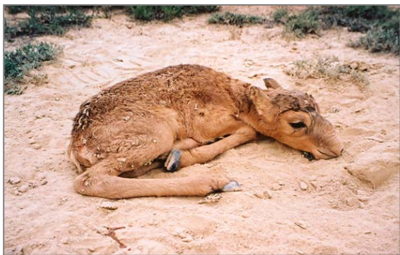
Ақбөкен лағы. Үстірт, Қазақстан.

Зерттеу жұмыстары 2004-2006 жылдары қазақстандық Үстіртте жүргізілді. 2004 ж. ақбөкеннің төлдеуі 14-ші мамырда басталды. 14-26 мамыр аралығында 595 ақбөкен лағы (құралайы) кездесті. Туғанына 0,5-2 тәулік болған лақтарының салмағы 3100-3850 г, дене мөлшері – 510-600 мм (n=9) болса, 3 тәуліктен кейін салмақтары 3950-4600 граммға, дене тұрқы - 600-660 мм-ға (n=4) өсті. Еркектері мен ұрғашыларының дене мөлшерінде айырмашылық онша емес. 13 лақтың 7 (53,8 %) еркек, ал 6 (46,2 %) ұрғашы болды. Аналықтары көбіне бір лақтан туса, екі лақ тууы одан төменірек. Мысалы, кездескен 133 аналықтың 87-сі (65,4 %) бір лақтан, ал 46-сі (34,6 %) егізден тапты. Орташа бір аналыққа 1,34 лақтан келді. Популяцияның өсімталдығы, өткен жылдармен салыстырғанда, төмендегені байқалады. Бұрын әр аналыққа орташа 1,5 лақтан келетін. Бұл жағдайда көбеюге қатыспаған ұрғашыларды есепке алу мүмкін емес. Мысалы «Лақтары мен аналықтары» арақатнасын тек жорамал түрінде экспедицияның соңғы екі күнінде (25-26 мамыр) есепке алуға болады. Бұл күндері ақбөкендер төлдеуін аяқтап, солтүстікке қарай бет алған уақытта олар өздерінің лақтарымен бірге болады. Осы екі күнде, 334 лақ пен 578 аналықтар кездесті. Бұл бір аналыққа орташа 0,57-ден лақ келеді деген сөз. Бұл қатынас шындыққа жақын, өйткені ақбөкен тобында өніп-өсуге қатыспаған ұрғашылары да болды ғой.