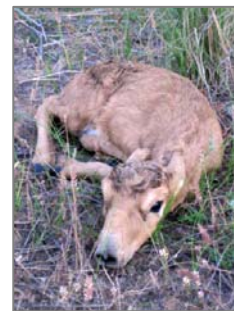
Жаңа туған ақбөкен құралайы.