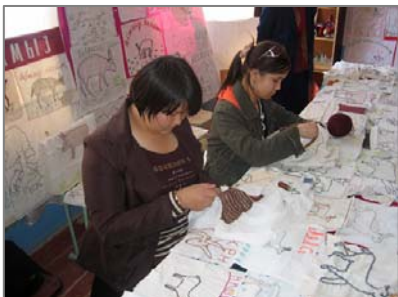
№ 56 мектептің оқушылары (пос. Қарақалпакия) кестеге ақбөкен суретін салуда.