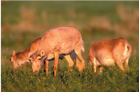
Зураг. Билчээрлэж буй шаргачин.

Казакстан: “Казакстанская правда” сонин, Дугаар 88-89, 2006 оны 4 сарын 14.