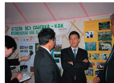
Зураг 3. Халимагийн ерөнхийлөгч Зэрлэг амьтдын төвийн захиралтай бөхөн хамгааллын талаар ярилцаж байна.

Төв нь үйл ажиллагаагаа Халимагийн байгаль орчны боловсрол, үйл ажиллагааны төв болох зорилготойгоор цаашид үргэлжилнэ. Олон улсын олон байгууллага санхүүгийн тусламж үзүүлдгийн тоонд Английн засгийн газрын Дарвины санаачлага, SEPS, Том өвсөн тэжээлтэн амьтдын сан, Америкийн загас, зэрлэг амьтдын алба, Денверийн амьтны хүрээлэн, Амьтны хүрээлэнг дэмжих сан, Колорадогийн амьтны хүрээлэн, ITERA, TNT экспресс.