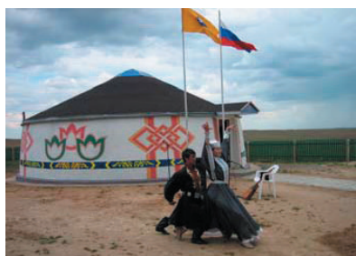
Зураг 2. Бүжигчид зочдын танхимын гадна талд давтлага хийж буй нь.

Зочдын танхим нь бөхөнгийн экологи, хамгааллыг харуулсан үзүүлэн, Халимагийн соёл, ёс заншлын үзмэр, компьютерийн хэрэгсэл зэргээр хангагдсан. Үржлийн төв нь судлаачдад зориулсан багаж хэрэгсэл, сургуулийн хүүхдүүдэд зориулсан танхимтай. Орон нутгийн болон олон улсын боловсролын байгууллагуудтай нягт холбогдсон төдийгүй бөхөнгийн зан төрхийн талаар ажиглалт судалгаа хийх, тэжээн үржүүлэх арга техникт суралцах үйл ажиллагаа явуулах боломжтой.