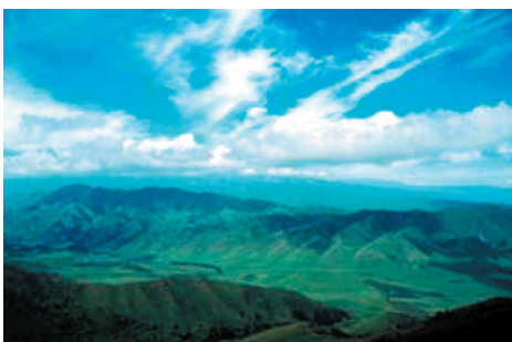
Шиа Эрксил БНГ.

Шиа Эрксил байгалийн нөөц газар (цаашид Шиа Эрксил БНГ гэх) нь Хятадын Шинжан автономит муж, Борталын монголын өөртөө засах орны Алатау уулын хойд бэлд E81.43.82.33 N45.07.45.23 солбицолд оршдог. Хойд тал нь Казахстантай хиллэнэ. Тус бүс нутгийн биологийн төрөл зүйл нилээд сайн хамгаалагдсан нь урт хугацааны турш хүний нөлөө байхгүйтэй холбоотой. Ийм онгон байдал Төв Ази болон Монголын ойролцоох нутагт ховор тохиолдоно. Хятадын Казахстантай хилийн ойролцоох Алла Пасс мужийн 58 км.квадрат талбайг Шиа Эрксил БНГ-ын мэдэлд байдаг. Нөөц газрын баруун өмнөд болон өмнө орших Харитурегийн ойн 36 км.квадрат талбай мөн Шиа Эрксил БНГ-т хамаарна. Иймд Шиа Эрксил БНГ талбайгаа 220 км.квадратаас 314 км.квадрат болтол өргөжүүлсэн нь байгалийн нөөц газрын ангиллаас үндэсний байгалийн нөөц газар болох талаар хүсэлт тавихад хүргээд байна.