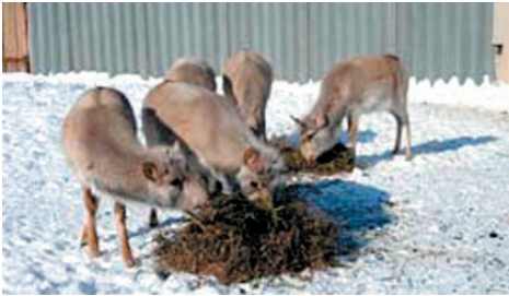
Залуу бөхөнд тэжээл тавьж байна

2005 оны 10 сарын эхээр бөхөн үржүүлэх төвд “Степной” нөөц газраас 5 сард барьсан 5 сартай 10 янзагыг тээвэрлэн нэмж авчирсан. Шинээр авчирсан янзагануудыг халаагуур бүхий хорогдох байртай задгай талбайд тусад нь хашсан. 2005 оны 12 сард өмнөх жилийн оононууд түрэмгий зан төрх үзүүлж эхэлсэн. Тэдгээрийн нэг болох бусдаасаа мэдэгдэхүйц том биетэй ооно илт давамгайлан түрэмгийлж эхэлсэн. 12 сарын сүүлчээр хамгийн сул дорой ооно үхсэн ба задлан шинжилгээгээр цус хуралт болон шарх авсан ул мөр илэрсэн. 2005 оны 12 сарын 24-нд амьтдын биеийн байдлыг үзэхэд бүгд сайн байсан. Зургаан шаргагчинг шижлүүлэн нэг оононы хамт задгай талбайд хашсан. Ооно орооны үеийн зан төрх үзүүлсэн ба үүний нэг нь сүрэг үүсгэх явц бөгөөд харин залуу оононууд мөн л хоорондоо мөргөлдөж тоглож эхэлсэн. 2005 оны 12 сарын сүүлч гэхэд бөхөн үржүүлэх төвд нийт 14 бөхөн байлаа.