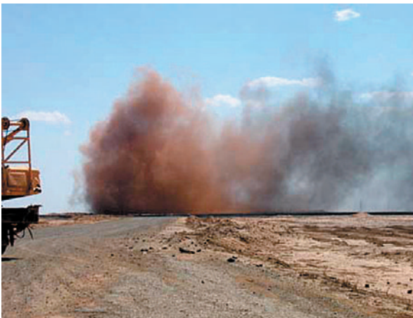
Тулэй хийн баазын ойролцоох хийн дэлбэрэлт.

Узбекистан улс байгалийн хийн нөөцөөрөө дэлхийд 8-р байр эзэлдэг. Нийт 2.44 триллион куб.м байгалийн хийн нөөцтэйгээс 1.7 триллион куб.м-нь Устюртад байдаг. Энэхүү тэгш өндөрлөг газар 250 зүйл сээртэн амьтад бүхий бахархмаар хосгүй байгалийн баялагтай. Эдгээрийн түлхүүр зүйл амьтдын нэг бол бөхөн юм. Энэхүү нутаг маш алслагдмал, эдийн засгийн хөгжлийн төвшин доогуур, харьцангуй бага хөндөгдсөн хосгүй экосистемтэй. Хэдий тийм ч “Арал” далайн байгалийн гамшиг нь эдийн засгийн хүнд нөхцөл байдлыг хүмүүсийн амьдралын түвшинг доройтуулах замаар улам дордуулж, улмаар ажилгүйдэл үүсч энэ нь зэрлэг байгальд халдах гол шалтгаан болсон. Ялангуяа бөхөнг хулгайгаар агнах явдал эрс ихэссэн. Гэсэн хэдий ч бөхөнгийн хувьд хулгайн ан бол дан ганц аюул занал биш юм. Орос, Узбекистаны хамтарсан төслүүдийн хэрэгжилтээр орон нутгийн эрчим хүчний салбарын хөгжил дээшилж байгаа бөгөөд энэ нь бөхөнгийн популяцид учирч болох боломжит аюул занал юм.