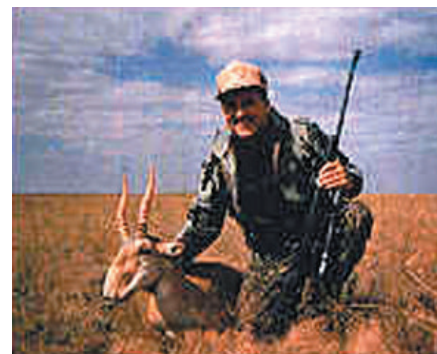
Зураг. 2006.02.02.

Батыс мужийн хилийн харуулууд 2006 оны 4 сард Казакстаны баруун хэсэгт бөхөнгийн хууль бус агнуурыг илрүүлж чадлаа. Узбекистаны хилээс ойролцоогоор 20 километр Казакстаны нутагт хулгайн ан хийж байсан 4 узбек иргэнийг саатуулсан байна. Тэдний машиныг шалган 11 бөхөн, нилээд хэдэн эвэр, винтов буу сумны хамт илрүүлжээ. Тус иргэдийг хариуцлагад татаад байна. Казинформын 13.04.2006 интернет мэдээнээс авав. Илүү мэдээлэл авахыг хүсвэл дараах хаягаар холбогдоно уу http://www.press-uz.info/index.php?id=2452 .