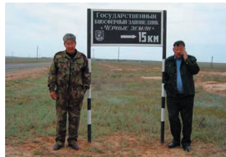
БНГ-ын хил дээр.

Энэхүү бөхөнгийн хамгааллыг сайжруулсан байгалийн нөөц газарт баруун хойд Каспий орчмын бараг бүх бөхөнгүүд ороо болон төллөлтийн үед бөөгнөрдөг. USFWS байгууллага нь "Large Herbivore Foundation" болон бусад ивээн тэтгэгчидтэй хамтран саяхан нээгдсэн Яшкулын бөхөн үржүүлэх төв дэх зочид хүлээн авах танхимын барилгыг мөн санхүүжүүлэв. Илүү мэдээлэл авахыг хүсвэл UNESCO/MAB-ийн Анна Луцкекина ( mab.ru@relcom.ru )-тай холбоо барина уу.