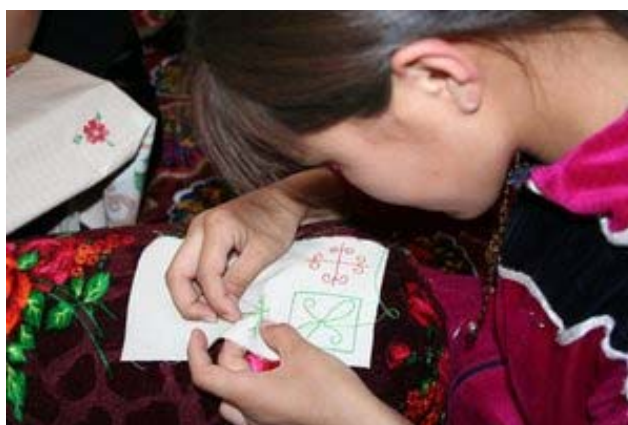
Эхний алхам. Яшлик тосгон дахь хатгамалын сургалт