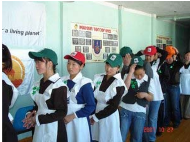
Эко-клубийн хүүхдүүд боловсролын уралдаанд

Нэмж хэлэхэд орон нутгийн сургуулиудад зургаан эко-клубыг оролцуулан олон нийтийг татах стратегийг санаачилсан байна. Хууль тогтоомжийн биелэлтийн чадавхийг ихээхэн дээшлүүлж, түүнээсээ ноогдол ашиг авдаг хулгайн антай тэмцэх баг 2007 оны 11-р сард 3 хулан, эм бөхөн, 2008 онд 1 ирвэс хулгайгаар агнасан зөрчил илрүүлсэн.