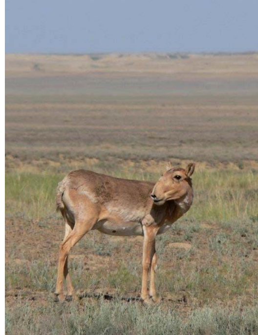
Үржлийн үеийн эм бөхөн. Бетбакдала.

“Алтин Дала” Байгаль Хамгаалах Санаачлага (ADCI) нь томоохон хэмжээний төсөл бөгөөд цөлөрхөг хээрийн экосистем, тал хээрийн хойд хэсэг төдийгүй уг бүс нутгийн шүхэр зүйл болох нэн ховор соргог бөхөн ( Saiga tatarica tatarica ), хавтгаалж шувууг ( Vanellus gregarius ) хамгаалахад чиглэгдсэн үйл ажиллагаа явуулдаг. Уг санаачлагыг Казахстаны засгийн газар, Казахстаны Биологийн Олон Янз Байдлыг Хамгаалах Холбоо (ACBK), Франкфуртын Амьтан Судлалын Нийгэмлэг (FZS),