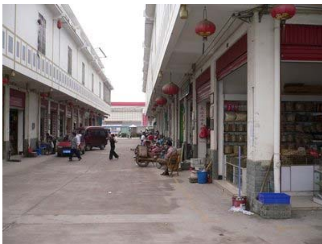
Хятадын уламжлалт анагаах ухааны түүхий эдийн зах. Зургийг Ли Лишү

Хятадын Ойн Аж Ахуйн Хэлтэс, Эрүүл Мэндийн Яам, Үйлдвэрлэл Худалдааны Хэлтэс, Хүнс болон Эмийн Хэлтэс, болон Хятадын Уламжлалт Анагаах Ухааны (ТСМ) Хэлтэс хамтран “Соргог бөхөн, панголин, болон зарим ховор могойн зүйлийн хамгааллыг сайжруулах, эдгээр амьтдын гаралтай эмийн түүхий эдийг зохицуулах менежментын тухай мэдэгдэл”-ийг 2007 оны 11-р сарын 12-нд гаргалаа. Панголин, зарим ховор могойн популяцийн огцом бууралт, мөн Хятадын зах зээл дэх бөхөнгийн эврийн хомсдлоос болж гаргасан уг мэдэгдлийн улмаас ТСМ-ийн эмийн нөөц хомсдох магадлалтай. Хятад руу хууль бус амьтны гаралтай түүхий эд гаргах явдал нь олон улсын байгууллагуудын санааг зовоож байна. Иймээс CITES болон IUCN нь соргог бөхөнг хамгаалах, хууль сахиулах үйл ажиллагаа болон хамгааллын менежментийг сайжруулах шийдвэрийг гаргасан.