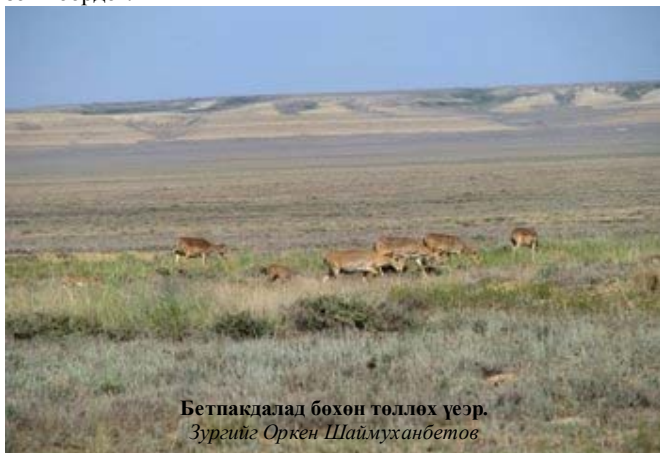
Бетнакалад бөхөн төллөх үеэр.

Казахстанд бөхөнгийн тоо толгой 1993 онд 1.300.000 хүрч байсан. Гэсэн хэдий ч 2003 он гэхэд зөвхөн 21.000 орчим бөхөн тоологдсон байна. Энэхүү тоо толгойн бууралтанд олон хүчин зүйл нөлөөлсөн ба 1993 оны зудны үеэр олон тооны бөхөн Узбекистан руу нүүсэн. Эдгээр амьтад тухайн зудны үеэр айлын байшин руу орж ирсэн ба тэр үед нь хүмүүс тэдгээрийн дийлэнхийг агнасан байна. 1995 оноос хүний нөлөөнөөс шалтгаалсан сүйрэл газар авч эхэлсэн. Гэвч бөхөнгийн эврийг худалдаж эхэлснээр бөхөнг агнах явдал улсын хэмжээнд тэсрэлт болсон. Хулгайн анчид агнасан амьтныхаа зөвхөн эврийг нь авч махыг хаядаг байсан байна. Үүний үр дүнд тал хээр бөхөнгийн сэг зэмээр дүүрсэн. Эдгээр бөхөнгийн эврүүд Хятад руу худалдаалагдаж эхэлсэн. Дөнгөж 1999 оноос эхлэн хүнд сурталтнууд бөхөнд учирч буй эмгэнэлт явдлын талаарх байгаль хамгаалагчдын дуу хоолойг сонсож эхэлсэн байна. Ингээд бөхөн агналтыг хорих асуудал тавигджээ. Одоогийн байдлаар нийт бөхөнгийн тоо толгой 61.000 орчим байна. Устьюртын бөхөнгийн популяцийн тоо толгойн бууралт өнөөг хүртэл үргэлжилсээр байна. Өнгөрсөн жилийн судалгаагаар Устьюртын бөхөнгийн тоо толгой 15.000 орчим байсан бол энэ жил ердөө 10.000 орчим л тоологдсон байна. Амьтан судлаачдын үзэж байгаагаар энэхүү тоо толгойн бууралт нь бөхөнгийн сүрэг өвлийн улиралд Узбекистан болон Туркменистан улсууд нүүдэллэсэнтэй холбоотой гэж үзэж байгаа бөгөөд эдгээр газар нутгууд бүрэн хамгаалагдаагүй байна. Хөрш орнууд мөн энэ хүчин зүйлийг хүлээн зөвшөөрдөг.