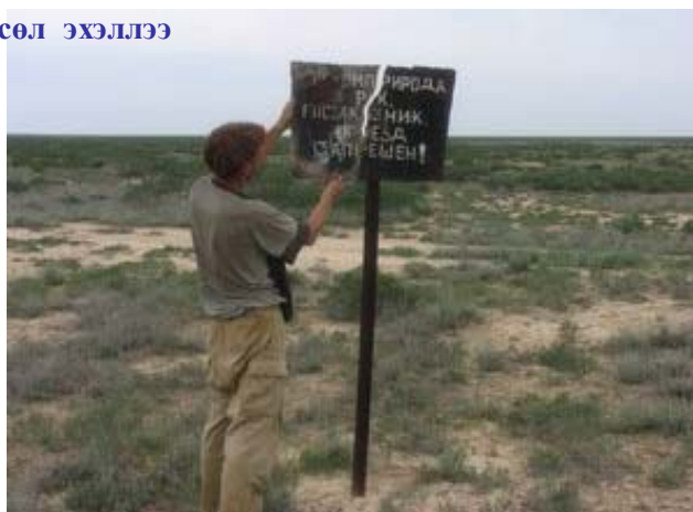
Сайгачи тусгай хамгаалалттай газрын хугархай самбар.

Сайгачий дархан цаазат газрыг 1991 онд 1 сая га талбайтайгаар бөхөнгийн төллөдөг нутгуудыг хамгаалахын тулд тусгайлан байгуулж байсан. Гэвч дэд бүтэц, тэсвэр болон ажилчдын орон тоо хангалтгүй учраас одоогийн байдлаар үйл ажиллагаа явуулаагүй байна. Ойролцоо амьдардаг орон нутгийнхан үүний тухай юу ч мэддэггүй байна. Иймд дархан цаазат газрыг илүү үр дүнтэй хэлбэрээр дахин зохион байгуулах шаардалагатай юм. 2008 оны 4-р сард Бөхөн хамгаалах холбоо Олон улсын ургамал амьтдын сан, Орос Узбекистаны амьтан судлалын хүрээлэн, Диснейн Зэрлэг амьтдын сан, Зэрлэг амьтан ажиглагчдын сангийн санхүүгийн дэмжлэгтэйгээр тусгай хамгаалалттай нутагт Сайгачий дархан цаазат газрыг илүү үр дүнтэйгээр дахин зохион байгуулахад бэлтгэн, шинэ төслийг эхэлсэн.