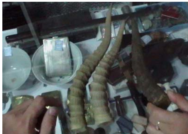
Захуудаас хураагдсан бөхөнгийн эвэр.

Канминг нисэх буудлын аюулгүйн хяналтын үеэр 2008 оны 1-р сарын 20-нд Зежианг мужийн иргэн хатагтай Лигийн тээшнээс хоёр ширхэг бөхөнгийн эвэр илэрсэн ба түүнийг саатуулсан байна. Ли хэлэхдээ тэрээр уг хоёр эврийг Канминг хотод байрлах Хятадын Анагаах Ухааны Эм (ХАУЭ) зардаг Жихуаюан зах дээрээс худалдаачин Зоугаас нийт 1800 рмб (~225$)-аар хадам ээжийнхээ эмчилгээнд зориулан худалдан авсан хэмээн мэдэгджээ. Уг мэдээллийн дагуу орон нутгийн цагдаагийн газар тухайн өдрийн орой ХАУЭ-ын Жихуаюан зах дээрх Зоугийн дэлгүүрт шалгалт хийхэд 28 бөхөнгийн эвэр илэрчээ. Зоу мэдүүлэхдээ уг эврүүдийг гурван жилийн өмнө ХАУЭ-ын зах дээрээс Шинжианы иргэдээс 30 эврийг кг-ийг нь 6800 рмб (~850$)-оор тооцон худалдан авсан хэмээн хэлжээ. Хятадын Шинжлэх Ухааны Академийн харъяа Канмингийн Амьтан Судлалын Хүрээлэнгийн шинжээчдийн дүгнэлтээр эдгээр 30 эврийн 22 нь бөхөнгийн эвэр болох нь тогтоогдсон бөгөөд бөхөн нь Хятадын Дархан Цаазтай Амьтдын 1-р зэрэглэлд багтдаг байна. Одоогоор уг хоёр сэжигтнийг эрүү үүсгэн шалгаж байна.