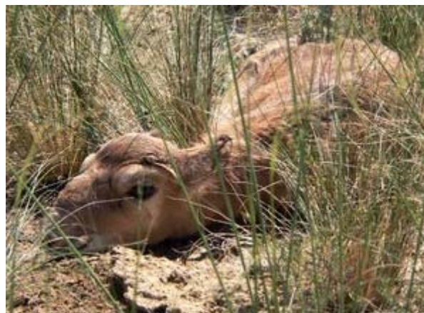
Бетпакдалад төрсөн нялх язага, 2008 оны хавар.

Казахстан улсын бөхөн хамгаалах байгууллага болон CMS-ын хэрэг эрхлэх газар хамтран бөхөн тархсан улс орнуудыг оролцуулсан олон улсын хурлыг 2006 оны 9-р сард Алматад зохион байгуулсан ба энэхүү хурал нь “Соргог Бөхөнгийн Хамгаалал, Менежмент”-ын тухай Харилцан Ойлголцлын Санамж Бичиг (ХОСБ) хэрэгжүүлэхэд чиглэгдсэн. Бөхөн тархсан улс орнууд буюу Орос, Узбекистан, Туркменистан, Хятад, Монголын төлөөлөгчид мөн олон улсын байгууллагуудын төлөөлөгчид уг хуралд оролцсон. Энэхүү хурлын үеэр Казахстан улс ХОСБ-т гарын үсэг зурлаа. Казахстан, ОХУ, Узбекистан, Туркменистан улсууд ХОСБ-ийг үр нөлөөтэй хэрэгжүүлэхийн тулд хамтын ажиллагааны хоёр талт гэрээ байгуулах шаардлагатай юм. Бүгд Найрамдах Казахстан улсын Хөдөө Аж Ахуйн Яам дээрхитэй төстэй гэрээг 2007 оны 5-р сард Туркменистан улсын засгийн газартай байгуулсан. Узбекистан улс руу хил дамнан нүүдэллэдэг Устьюртын бөхөнгийн популяцийг хамгаалах асуудал хамгийн том саад бэрхшээл ба үүнийг шийдэхийн тулд хамтарсан судалгаа болон хамгаалал шаардлагатай. Энэ зорилгын үүднээс засгийн газар хоорондын гэрээний нооргийг Зөвлөл бэлтгэсэн бөгөөд үүнтэй төстэй Уралын бөхөнгийн популяцийг хамгаалах гэрээг ОХУ-тай байгуулахаар бэлдээд байна. Эдгээр материалуудыг Орос болон Узбекикийн талуудад танилцуулсан ба 2008 онд гарын үсэг зурна хэмээн найдаж байна.