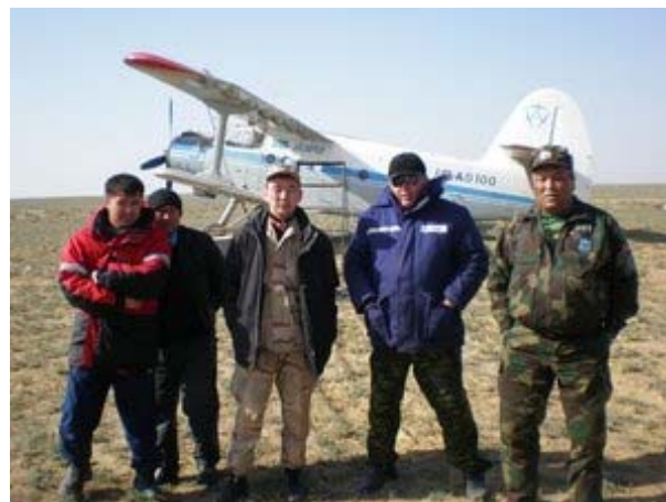
Охотзоопромны судлаачид Босой тосгоны ойролцоох агаарын станцад Устюртын популяцийн тархацыг судлаж байхад. 2008 он.

Зөвлөлийн орон нутгийн хэлтэс болон хууль сахиулах байгууллагуудыг мөн бөхөн хамгаалалд татан оролцуулсан. Бөхөн хамгаалах хөдөлгөөнт эргүүлүүд галт зэвсэг, сансрын холбоо, камер, зургийн аппарат, хөдөлгөөнт холбоогоор бүрэн тоноглогдсон. Тэр ч бүү хэл “Охотзоопром”-нь МИ-2 нисдэг тэрэг худалдан авсан ба үүнийг одоогоор бөхөн хамгаалалд ашиглаж байна. 2005-2007 онуудад Зөвлөлийн орон нутгийн хэлтсийн улсын байцаагчид, хууль сахиулагчид, “Охотзоопром”-ын ажилчид нийт 34 хулгайн анг илрүүлсэн ба эдгээр хулгайн анчид хууль бусаар нийт 210 бөхөн агнажээ. Эдгээр хулгайн ангийн хэргүүдийг шүүхэд шилжүүлэн зохих арга хэмжээнүүдийг авсан. Учруулсан хохиролынхоо төлөө эдгээр хулгайн анчид нөхөн төлбөр төлөх шаардлагатай байгаа юм.