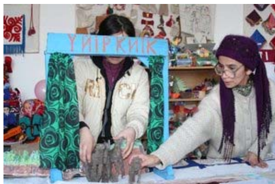
Каракалпак тосгон дахь жүжгийн хүүхэддэй сургууль

Харамсалтай нь тэдний хэсэгхэн нь урлагийн тоглолтын талбайд тоглосон. Ирэх жил бид өөрсдийн ажлаа Узбекистаны хүүхдүүдийн бичсэн бөхөнгийн тухай шидэт үлгэрийн ном бэлдэхийн тулд багш нартай үргэлжлүүлэн ажиллах төлөвлөгөөтэй байна. Энэ нь хүмүүсийн бөхөн рүү болон байгаль руу хандах хандлагыг өөрчлөхөд ерөнхийд нь туслах болно гэдэгт бид бат итгэлтэй байна. Энэ нь зөвхөн уламжлалт агнуурын зүйл төдийгүй үндэсний өв, нутгийн соёлын нэг хэсэг болох бөхөн рүү хандах насанд хүрэгчдийн-эцэг эх, ах, эгч нарын хандлагыг өөрчлөх болон өсвөр үеийн хүмүүжлийг бий болгоход хүчтэй түлхэц өгөх болно. Цаашидын мэдээллийг авахыг хүсвэл SCA-ийн Елена Быкова болон Александр Эсинов нартай esipov@sarkor.uz нартай холбогдоно уу.