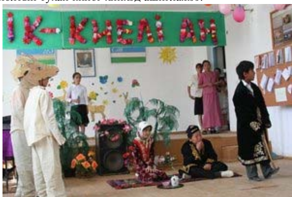
Яшлик тосгон дахь бөхөнгийн урлагийн тоглолт.

WCN-ээс санхүүждэг Бөхөн хамгаалах холбооны баг нь хэдэн жилийн турш Устюрт, Узбекистаны хүүхдүүдэд боловсролын хөтөлбөрийг аль хэдийнээс хэрэгжүүлсэн билээ. Хулгайн ангийн түвшин өндөр байдаг тосгоны (Яшлик, Каракалпак) гурван сургуулийн багш, хүүхдүүд, түүгээр зогсохгүй тэдгээрийн эцэг эхчүүд бөхөн хамгаалах хөтөлбөрийн идэвхитэй хэсэг болж байна. Устюртийн тэгш өндөрлөгийн зүүн хэсгийн алслагдсан районд орших (Кубла-Устюрт) шинэ тосгоноос ирсэн сургуулийн хүүхдүүдийг оролцуулснаар манай хөтөлбөр улам бүр өргөжсөөр байна. Бөхөнгийн тухай урлагийн тоглолт сургуулиуд дээр 2008 оны 3-4-р сард болсон. Хүүхдүүдийн, багш нарын, эцэг эхчүүдийн нилээд их ажил, урлагийн тоглолтонд орсон. Хүүхдүүд бөхөнгийн тухай түүх, шидэт үлгэр, богино өгүүллэг, шүлэг бичсэн. Шүүгчдийн бүрэлдэхүүнээс сонгон авсан хамгийн сайн түүхийг урлагийн тоглолтын тухай киног хийхэд ашиглажээ.