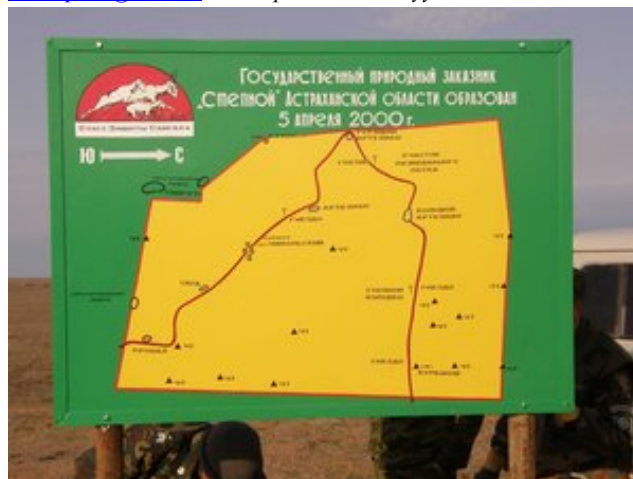
Степной дархан газрын экологийн замын бүдүүвч Зургийг Анатолий Хлуднев

Тэнд амарч байгаа болон ярилцах хүмүүст зориулсан газрууд, нөгөө талаас бөхөн байнга ирдэг цэвэрхэн тогтоол уснууд, махчин шувуудад зориулан босгосон хиймэл үүрнүүд бий. Экологийн боловсролын ажил ирээдүйд улам бүр өргөжин хөгжих болно. Илүү мэдээлэл авахыг хүсвэл Степной дархан газрын Анатоли Хлудневтай limstepnoi@mail.ru хаягаар холбогдоно уу.