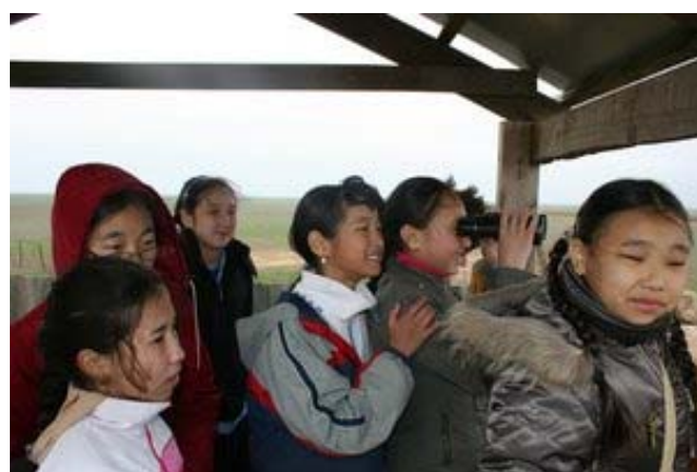
Яшкилын үржүүлгийн төв дэхь Халимагийн сургуулийн хүүхдүүдийн аялал