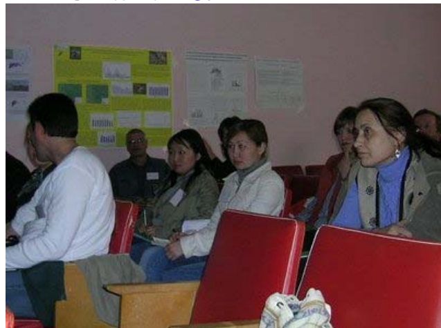
Оролцогчид олон улсын сургалтын үеэр

Дэлгэрэнгүй мэдээлэл авахыг хүсвэл Оросын Шинжлэх Ухааны Академийн СНЭЭХ-ийн Наталья Арыловатай холбоо барина уу! arylova@gmail.com .