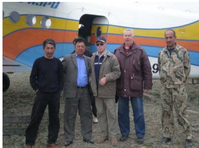
Охотзоопром болон Амьтан судлалын хүрээлэнгийн хамтарсан баг Уралын популяцийн тархац нутгийг судлах үеэр.