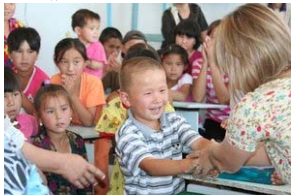
Кубла-Устюрт тосгон дахь урлагийн тэмцээний ялагчдыг шагнаж байгаа нь

Харамсалтай нь тэдний хэсэгхэн нь урлагийн тоглолтын талбайд тоглосон. Ирэх жил бид өөрсдийн ажлаа Узбекистаны хүүхдүүдийн бичсэн бөхөнгийн тухай шидэт үлгэрийн ном бэлдэхийн тулд багш нартай үргэлжлүүлэн ажиллах төлөвлөгөөтэй байна. Энэ нь хүмүүсийн бөхөн рүү болон байгаль руу хандах хандлагыг өөрчлөхөд ерөнхийд нь туслах болно гэдэгт бид бат итгэлтэй байна. Энэ нь зөвхөн уламжлалт агнуурын зүйл төдийгүй үндэсний өв, нутгийн соёлын нэг хэсэг болох бөхөн рүү хандах насанд хүрэгчдийн-эцэг эх, ах, эгч нарын хандлагыг өөрчлөх болон өсвөр үеийн хүмүүжлийг бий болгоход хүчтэй түлхэц өгөх болно. Цаашидын мэдээллийг авахыг хүсвэл SCA-ийн Елена Быкова болон Александр Эсинов нартай esipov@sarkor.uz нартай холбогдоно уу.