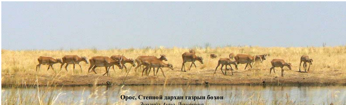
Орос, Степной дархан газрын бөхөн

Та бүхэн илүү тодорхой мэдээлэл болон өргөдлийн маягтыг www.saiga-conservation.com , эсвэл esipov@sarkor.uz , saigaconservationalliance@yahoo.co.uk хаягаар хандан e-майл-ээр авч болно. 2008 оны 9-р сарын 30-ны өдөр өргөдөл хүлээн авах хугацааг хаах бөгөөд төсөл 2008 оны 11-р сарын 15-наас нэг жилийн хугацаатай үргэлжилнэ.