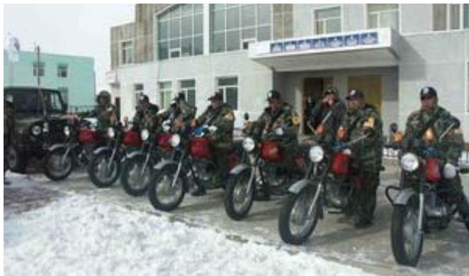
Бөхөн хамгаалагчдын сүлжээ.

Энэ хэрэг цагдаад шалгагдаж байна. 2006 онд баригдсан 54 бөхөн хулгайгаар агнасан хэргийг дахин хянан шалгаад 2007 оны 10-р сард шүүх шийдвэрлэсэн. Дэлхийн байгаль хамгаалах сангийн Монгол дахь хөтөлбөрийн газар нь эхний хэргийг үл ойшоож байсан орон нутгийн шүүгчдийг жагсаалтыг гаргаж, мэргэжлийн бус удирдлагуудыг огцруулахад үүрэг гүйцэтгэсэн. 2008 оны 1-р сарын тооллого судалгаагаар 13000 км 2 нутагт 3240 бөхөн гэж үнэлсэн нь 2007 оныхоос 11.8%-иар өссөн байна. Энэхүү эргэн тойрон дахь явдал нь ердөө баримтууд бөгөөд Дэлхийн байгаль хамгаалах сан (WWF)-гийн Монгол дахь хөтөлбөрийн газрын дэлгэрэнгүй тайлан SCA вебсайтад хангалттай байгаа. Илүү нарийн мэдээлэл авбал Б.Чимэддорж, chimeddorj@wwf.mn -д холбогдоно уу.