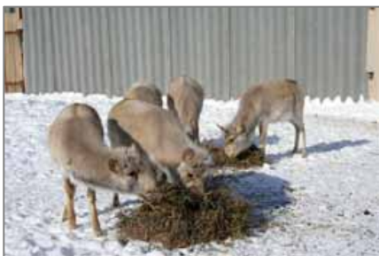
Сайгоқчаларни озиқлантириш

. Кундузи эркагини урғочиларига ирғиши кузатилмади. 27 декабр куни, бизнинг кузатишларимиз вақтида эркагида куйкиш белгилари ва урғочиларига қизиқиши кўринмади. 12 январдан 15 январгача оёғи хали тузалмаган шикастланган урғочиди (унга Жади деб ном қўйилди) куйкиш белгилари кузатилди. 12 январ куни эрталабки озиқлантириш вақтида, урғочиси куйкиш қаттиқ товуш чиқарди, бунга балоғатга етган эркаги фаол жавоб қайтарди. Ундан шифер тўсиги билан ажратилган еш эркаклари ҳам хаяжонландилар ва жавоб бердилар. Жади яримочиқ вольер эшигидан чиқиб кетишга уринарди, бундай ҳолат илгари кузатилмаган эди. Январ ойида еш эркакларида куйкиш белгилари ва куч синаш элементлари билан фаол ўйноқлик ахлоқлари кузатилди. Бошқа хайвонларга нисбатан оқсоқ эркаги ўсишда бир қанча орқада қолиб, кам ҳаракатчан эди. Уччала урғочи ҳам қочган эди. Биринчи сайгоқ боласи (эркаги) 17 май куни соат 18 да туғилиб, 1,5 соатдан кейин ўрнидан туриб, онасини чақирди. Иккинчи сайгоқча 19 май куни туғилди. 14 июнда Жадининг сайгоқчаси туғилди