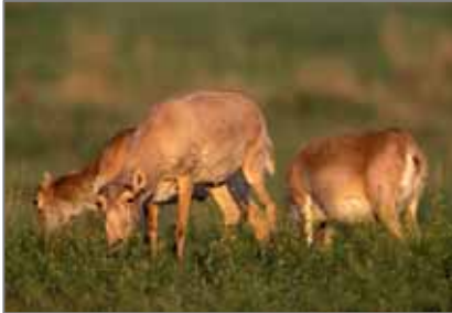
Ўтлаётган сайғоқ ургочилари.

2005 й. ноябр ойида Қалм. Респ. Росқишлхўжназорати тезкор овназорати овшунослари браконьерлик содир бўлган жойни аниқладилар, бироқ браконьерлар жиноят содир бўлган жойдан Утта ва Хулхута пос. томонга кетишга муваффақ бўлдилар. Ноқонуний ов жойида сайғоқнинг 12та танаси топилди, буларнинг бир қисми олиб кетишга тайёрланган эди. Эрақ сайғоқларга нисбатан бундай муносабат жиноийдир, чунки бу популяциянинг генетик хилма-хиллигига сезиларли зарба беради. Биз сизларни бундай ходисалар ёнидан бефарқ ўтмаслигингизни сўраймиз. Сайғоқ тақдирига бефарқ бўлмаган барча –браконьерлик ҳолатлари ҳақида Росқишлхўжназорати Бошқармасига хабар беришлари мумкин. Агарда Сизлар томонда сайғоқлар бир неча йил кўринмаган бўлиб, Сиз уларни чўлда учратиб қолсангиз, бундан ҳам бизни хабардор қилинг. Б. Убушаев, Қалм. Респ. бўйича Росқишлхўжназорати Бошқармаси овназорати бўлимининг бошлиқ ўринбосари