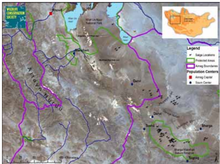
Расм. Ғарбий Монголияда сайғоқни замонавий ўрганиш натижалари

Командамиз Шарга-Манхан кўриқхонаси ва унинг атрофлари, Хар Ус Нур Миллий боғи ва Хуйсин Гоби (расмда уч хафталик кузатишларни ўтказди. 10чи октябрдан 19чи октябргача умумий олганда 460та сайғоқ ҳисобга олинди. Ундан ташқари Дарив (Д. Чинунен) сомонининг назоратчиларидан бири Шарга-Манхан кўриқхонасидан шимоли-ғарбий йўналишда яна 100та ҳайвонни ҳисобга олган. Мадомики, бизнинг мақсадимиз кейинги дала ишлари учун потенциал ҳудудларнинг яроқчилигини баҳолашда бўлгани учун, текшириш бирор бир батартиб услубда ўтказилганлиги йўқ. Демак, текшириш натижалари Монголия сайғоғининг ҳозирги сонини репрезентатив ҳисобга олиниш сифатида кўрилмаслиги керак. Бироқ кузатишлар кўрсатдики, ҳайвонларнинг ахамиятли сони ёввойи табиатда, ва шунинг учун сайғоқнинг яшаш жойларини сақлаб қолишга қаратилган ҳаракатларни кучайтиришни давом эттириш лозим.