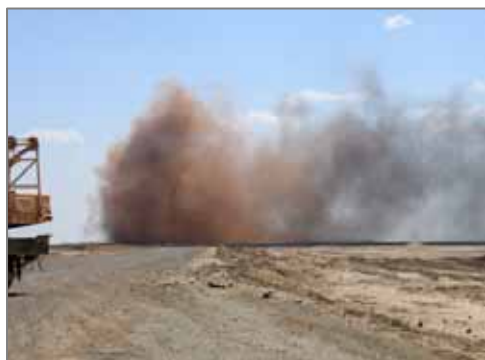
Туллей газоконпрессор станцияси яқинида газнинг авариявий чиқарилиши.

Табиий газ қазиб олиш бўйича Ўзбекистон 8чи ўринни эгаллайди. Ўзбекистон заҳираларининг 2,44 триллион кубометр газидан 1,7 триллион кубометри Устюрт платосида жойлашган. Устюрт платоси, шунингдек умуртқали хайвонларнинг 250 тури учрайдиган, ноёб табиий ресурслик ҳудуд бўлади. Сайгоқ Устюрт фаунасининг муҳим вакилларида бири ҳисобланади. Регионнинг узоклиги ва бориш қийин бўлганлиги, шу билан бирга ўзлаштирилганлигининг пас даражаси, ноёб табиий комплексларни деярли тегилмаган ҳолда сақланишига имкон берди. Бироқ, аҳолини фаровонлигини пасайишига ва ишсизликка олиб келган, Орол муаммоси билан чуқурлашган иқтисодий вазият табиатга антропоген таъсирини кучайишининг сабабларидан бири бўлди. Хусусан, сайгоқни ноқонуний овлаш даражаси бир неча бор ошди. Бироқ браконьерлик – ноёб тур учун ягона хавф-хатар эмас. Устюрт регионининг энергетика секторини ривожлантириш соҳасидаги Ўзбекистон ва Россия биргалигида лойиҳаларини амалга оширилиши сайгоқнинг аҳолини ёмонлашишига жиддий асос бўлади.