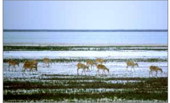
Кўчиб юрвчи сайгоқлар.

Илгари Устюрт супасида кўчиб юриш йўллари ҳар хил йилларда қаттиқ ўзгарган: баъзида Бузачи яриморол еки Жанубий Устюртга, баъзан эса Сам қумликларигача етиб борган сайгоқларнинг биргина устюрт группировкаси яшайди деб ҳисобланган. Буни еки одам томонидан қизғин таъқиб қилиш, е оғир иқлимий шароитлар билан боғлашган. Кейинчалик 1954 йилда шимолий саҳро сайгоқлари Устюрт супасига ўтиб, кейинчалик янги кўчиш йўлларини ҳосил қилган мустақил группировкалар шакллантирган. Уларнинг қишловлари Устюрт Жанубий чинкида, Жанака, Заунгуз Қорақумларида жойлашган. Езда уларнинг кўпчилик қисми шимолга кетган, бошқалари эса қолган. Шимолий - Ғарбий Туркменистонда уларнинг сони қиш даврида 40 –50 минг бош, езда эса – бир неча юздан 30 мингтагача етган. Ушбу иш мақсади – Орол-Каспий сувайирғичи, Орол ва Каспий денгизлари оралиғида жойлашган кенг саҳро региони, Қозоғистон, Ўзбекистон (Қорақалпоғистон) ва Туркменистон ҳудудларида сайгоқнинг яшаш тавсифини аниқлаш.