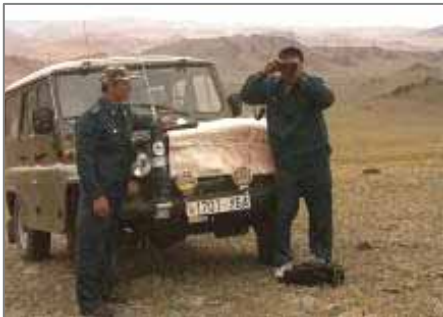
Ирбис-3 браконьерликка қарши мобил гуруҳи.

Қалмоғистон рамзи – сайғоқча 2006 й. 21 сентябрдан 13 октябргача Элистада болгариялик Веселин Топалов ва россиялик Владимир Крамник ўртасида ўтказилган шахмат бўйича жаҳон биринчилиги учун матчининг расмий тумори бўлиб қолди. Эмблема лойиҳасининг муаллифи таниқли қалмиқ расмони Сергей Бадендаев. Батафсил http://www.elista.org/elista/index.php?option=com_content&task=view&id=758&Itemid=2 да.