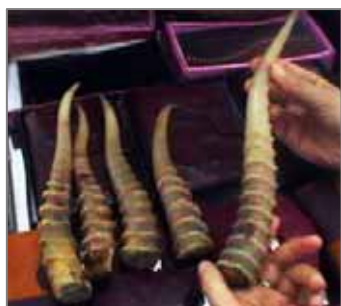
Сайғоқ эркагининг шохи Аньанавий Хитой медицинасида ишлатилади. Джаоя-Хейхе сурати.

Ҳозирги вақтда, ҳамкор ташкилот сифатида Кўчиб юрвчи турлар бўйича Конвенцияга имзо чеккан FFI Қозоғистон ва Ўзбекистон Устюртида сайғоқни сақлаб қолиш бўйича ишни кенгайтиришни режалаштирган. Халқаро Фауна ва Флора Фонди сайғоқ ареалининг 4 давлатларида сахро чўллари ва сайғоқнинг муҳофазасига жалб этилган маҳаллий ташкилот ва муассасаларни қўллаб-қувватлашга ва ҳамкорлик лойиҳаларига очик. Кўшимча маълумот учун FFI, ralcorn@fauna-flora.org Ричард Оллокорнга мурожаат қилинг