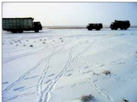
Жаслик ст. худудида автотрассани кесиб ўтган, сайгоқ излари (2004 й. декабр).

Сайгоқни қириш ва нимталарини олиб чиқиш бир неча кун давом этди, бироқ, на кўрсатилган аҳоли пунктларининг маъмурияти, на ҳуқуқий қўриқлаш органлари қирғинни тўхтатиш учун ҳеч қандай чора кўрмадилар. Ўша йили кўчиб ўтган сайгоқларнинг юқори сони бошининг кўпайиши билан эмас, Қозоғистонда кўп еққан қорлар ва озуқа нинг етишмаслиги билан боғлиқ эди.