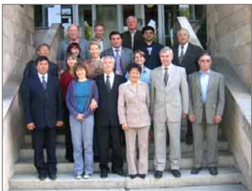
Сайғоқ бўйича мутахассислар Алматида учрашдилар.

INTAS «Кескин хавф остидаги сайга антилопасининг репродуктив экологияси» лойиҳаси иштирокчиларининг якуний учрашуви 2006 й. 21-22 сентябрларида Қозоғистон, Алмати ш. бўлиб ўтди. Учрашув бизларга илмий натижалар ва ғоялар билан алмашишга, таҳлил стратегиясини уйғунлаштиришга, лойиҳа якунигача (2007 й. март ойи) бўлган сўнгги даврнинг натижаларини босиб чиқаришга имкон берди. Лойиҳа Қозоғистон, Ўзбекистон ва Россияда бажарилди. Асосий мақсади сайғоқ подаларининг тарқалиши ва тавсифи, репродуктив муваффақиятни кузатишнинг ноинвазив усуллари бўйича маълумотларни ўзига оладиган, мониторинг қарорларини тузиш ва тестдан ўтказишдан иборат эди. Лойиҳа ўз доирасида, инсонларнинг сайғоққа бўлган муносабати ва уларнинг бу турга нисбатан бўлган ахлоқининг социологик тадқиқотларини ўтказиш учун мониторингнинг бир хил стандарт воситаларини ишлаб чиққан, яқинда тугаган «Қишлоқ аҳолиси фаровонлигини оширишда сайғоқдан фойдаланиш» Дарвин Ташаббусининг лойиҳаси билан ҳам биргаликда ҳаракат қилди. Ва, ниҳоят, биз олимлар, маҳаллий аҳоли ва сиёсатчилар орасида сайғоқнинг экологияси ва сақлаб қолиш бўйича ахборот тарқатамиз.