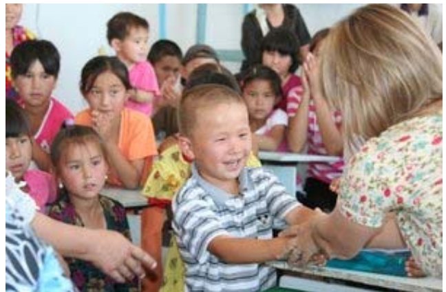
Кубла-Устюрт п. ғолибларни мукофотлаш.

анъаналарга бой эди. Афсуски, уларнинг ҳаммаси ҳам болалар спектаклларининг сюжетига кирмади. Кейинги йилда ишимизни давом эттириб, педагоглар билан биргаликда Ўзбекистон болалари ёзган, сайғоқ тўғрисидаги эртақлар китобини нашр этишга тайерлашни режалаштирдик. Биз ишонамизки, бу сайғоққа ва умуман она юртимизнинг табиатига тўғри муносабатни шакллантиришга ердам беради, ёшларнинг ижодий ривожланиши учун кучли рағбатлантирувчи омил бўлади, ҳамда катталар – ота-она, ака-опаларнинг сайғоққа бўлган муносабатини ўзгартиради ва улар сайғоқни фақат анъанавий овлаш объекти деб эмас, балки миллий бойлик ва маҳаллий маданиятнинг қисми деб биладилар. Қўшимча маълумот учун esipov@sarkor.uz Е.Бикова ва А.Есуповга мурожаат қилинг.