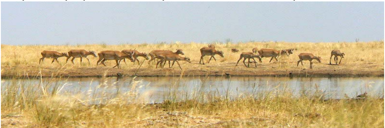
«Степной» заказникда сайгоқлар, Россия.

Кўпроқ маълумот ва талабнома(заявка) шаклини www.saiga-conservation.com сайтида ёки электрон почта орқали esipov@sarkor.uz ва saigaconservationalliance@yahoo.co.uk да олишингиз мумкин. Талабнома топширишнинг охириги муддати 2008й. 30 сентябрь. Лойиҳа давомийлиги 2008й. 15 ноябрдан бошлаб 1 йил.