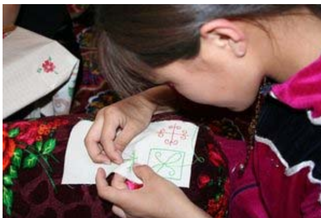
Жаслик пос-да анъанавий кашта тикишнинг биринчи сабоқлари.

Бу лойиҳанинг амалга ошиши мураккаб жиҳоз ва катта маблағ сарифлашни талаб этмайди, деярли ҳар қандай, фантазияси бор ва сабрли аёл бу билан уйда шуғилланиши мумкин. Биринчи лойиҳа Жаслик поселкасида ўтказилди ва 1 йилга мўлжалланган. Бизлар тренинг ўтказиш учун хона тайёрладик, ўқишга қизиққан аёллар гуруҳи тўпланди, жойдаги раҳбар аниқланди, кашта техникаси бўйича биринчи дарслар ўтказилди ва керакли сифатда биринчи маҳсулот ҳам олинди. Кейинчалик каштанинг кийинроқ элементларига ўргатиш давом эттирилади ва маҳсулот синаб кўриш учун сотилади. Сайғоқни сақлаш ғоясининг пропагандаси мақсадида, унинг стилизацияланган образини ишлаб чиқиб, ундан фойдаланишни режалаштирганмиз. Қўшимча маълумот учун esipov@sarkor.uz , Е.Бикова ва altyn1@rol.uz , Г.Ембергеновага мурожаат қилинг.