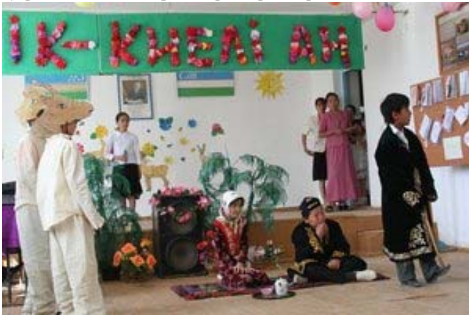
Жаслик п. сайғоқ тўғрисида спектакль.

Мана бир неча йилдан бери Сайғоқни сақлаш бўйича Альянсининг ўзбек командаси WCN молиявий ердамида Устюрт болалари учун таълим дастурини ўтказди. Сайғоқни сақлаш бўйича дастурга сайғоққа браконьерлик даражаси юқори бўлган, Жаслик ва Қорақалпоқ қишлоқларида жойлашган учта мактабнинг ўқитувчилари, ўқувчилари ва уларнинг ота-оналари фаол киришдилар. Шунингдек, биз учун янги бўлган, Устюрт платосининг шарқий чинкидаги узок, одам оёғи етиши қийин бўлган районда жойлашган, Кубла-Устюрт поселкаси ўқувчиларини жалб этиш ҳисобига дастуримизни кенгайттирдик. Жорий йилнинг март-апрель ойларида мактабларда сайғоққа бағишланган спектакллар кўрсатилди. Намойишдан олдин болалар, педагоглар ва ҳатто ота-оналар ижодий ишладилар. Болалар сайғоқларга бағишланган эртақ, новелла ва шеърлар ёздилар. Уларнинг энг яхшилари жюри томонидан ажратиб олинди ва сайғоқ тўғрисида спектакллар сценарийларини яратишда ишлатилди.