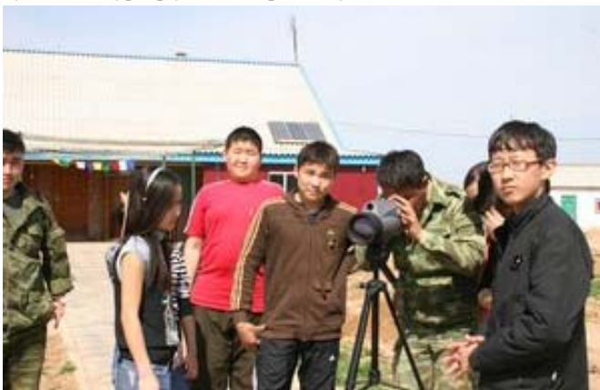
Қалмиқ мактаб ўқувчилари Яшқўл питомнигида экскурсияда.

Жонсиз чўлда сайгоқка ўрин йўқ. Шувоқнинг аччиқ ҳиди, суфитўрғайларнинг жаранлаган ашулалари, суғурлар чинқириғи, мовий осмонда парвоз қилаётган дашт бургутлари, антилопалар тўдалари, уя енида икки жуфт гўзал турна ... Бу чўл гўзалликларининг бирортасидан ҳам воз кечиш бўлмади. Чўл биоценозида ҳаммаси ўзаро боғлиқ ва ортқича, муҳимроқ ёки кераксизроқ ҳеч нима йўқ. Шунинг учун, иши кўп йиллар давомида “Йирик ўтхўрлар бўйича фонд” (LHF), 2008 йилдан эса Руффорд фонди (Rufford Small Grants Foundatuion) томонидан қўллаб-қувватланаётган “Қалмоғистон Республикаси ёввойи ҳайвонлар маркази” сайгоқни сақлаш бўйича ишлар билан чекланиб қолмайди. Ҳаётнинг барча хилма-хиллигини, такрорланмас чўл ландшафтларининг сақланиб қолиши аҳамиятсиз эмас. Марказ экологик таълим бўйича дастурлар ўтказиш орқали бу масалани ечяпти.