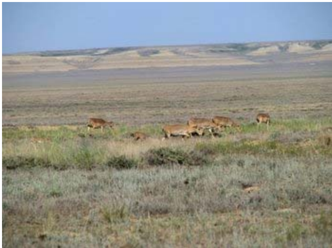
Сайгоқлар Бетпақдалада кўзилаш вақтида.

Ҳозирги вақтда сайгоқ сони 61 минг бошдан иборат. Шу билан бирга Устюрт популяциясининг қисқарилиши кетяпти. Ўтган йили уларнинг сони 15 мингга эди, бу йил эса 10 минг. Бунинг сабабини зоологлар сайгоқни қишда, ҳайвонлар тегишли равишда кўриқланмайдиган, Ўзбекистон ва Туркменистонга кўчиб ўтишида кўраётди. Буни кўшчиларимиз ҳам тан оладилар. Бу йилдан сув ресурслари ва ҳайвонот оламини сақлаш ва