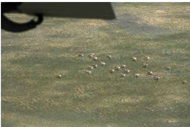
Сайгоқлар самолёт қаноти остида.

2007 йилга нисбатан сайгоқнинг умумий сони 11,3%га кўпайган, бироқ Устюрт популяцияси учун қисқариш белгиланган. Бу популяцияга нисбатан масала ҳали ҳам очик қолмоқда – учёт вақтида сайгоқнинг қандай миқдори Ўзбекистонда бўлади? Шубҳасиз, турли йилларда об-ҳаво, иқлим шароитларига боғлиқ бўлган ҳолда, сайгоқнинг бу миқдори ҳар хил бўлади. Бу масалани ечиш учун сайгоқ учетини иккала давлатда ҳам бир вақтда олиб бориш керак. Қўшимча маълумот учун terio@nursat.kz , ҚР МОН Зоология институти Ю.А. Грачевга мурожаат қилинг.