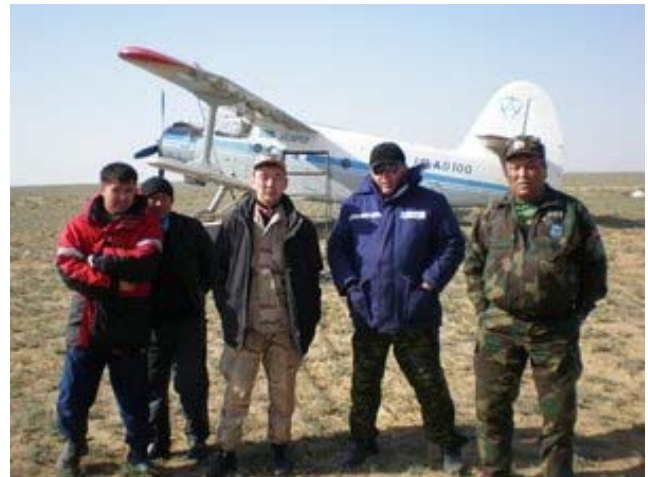
Охотзоопром инспекторлари Бозой п. атроф. дала аэродромида Устюрт популяциясини ҳисоблаш вақтида, 2008 й. баҳори.

Сайгоқ муҳофазаси унинг яшаш жойларида РГКП “ПО “Охотзоопром” томонидан амалга ошириляпти. 83 инспектордан иборат бўлган 9та мобил гуруҳ, 43та ўта қийин йўллардан ўта оладиган автотранспорт ва 4та спорт мотоциклини жалб этган ҳолда, вахта методи билан ишляпти. Шунингдек, сайгоқни кўриқлашда ўрмончилик ва овчилик хўжалиги вилоят ҳудудий бошқармаларининг давлат инспекторлари ва ҳуқуқни муҳофаза қилувчи органлар ходимлари ҳам иштирок этияпти. Мобил гуруҳлар табель қуроли, йўлдошли телефон, видео- ва фотокамера, ҳамда мобил радиостанция билан таъминланган. РГКП «ПО «Охотзоопром» томонидан «Ми-2» вертолетни сотиб олинган ва у ҳозирги вақтда сайгоқларни кўриқлашда ишлатилади.