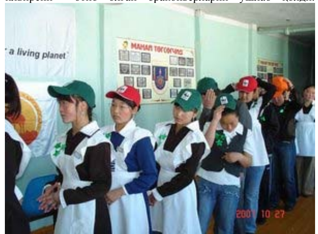
Болалар эко-клуби таълим дастурининг қисми сифатида.

Кўшимча равишда, жамоатчиликни жалб этиш бўйича дастур бошланди, шу жумладан маҳаллий мактабларда олтига эко-клуб тузилиши ҳам. Асосий ўзгариш қонунчилик базасига тегишли бўлди ва бу ўз натижаларини олиб келди; браконьерликка қарши команда 2007й. ноябрида сайгоқ урғочиси ва учта кулани ва 2008й. март ойида битта илвирсни отиб олган браконьерларни ушлаб қолди.