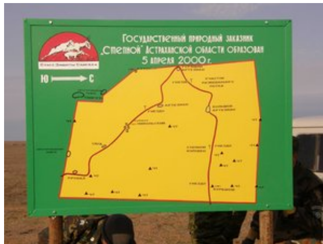
"Степной" Заказнигидаги экологик сўқмоқнинг схемаси. А.Хлуднев сурати

тўғрисида маълумот олишга, табиатимизни сақлаш учун ҳар биримизнинг қўлимиздан нима келишини яхшироқ тушинишимизга имкон берадиган экологик сўқмоқ жихозланди. Заказник худудида дам олиш ва суҳбат қуриш жойлари жихозланган, сайгоқлар мунтазам келиб турадиган қудуқлар тозаланган, йирткич қушлар учун сунний уялар қилинган. Экологик таълим ва маърифат бўйича ишлар кенгайтирилади ва такомиллаштирилади. Қўшимча маълумот учун limstepnoi@mail.ru , А.В.Хлудневга мурожаат қилинг.