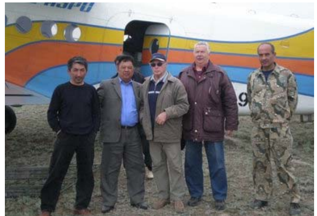
Охотзоопром ва Зоология институти ходимлари сайгоқни Урал популяциясининг учети вақтида.