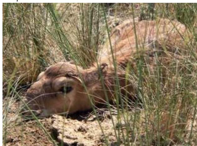
Бетпақдалада янги туғилган сайгоқча, 2008 й. баҳори.

Битимларнинг лойихаларида қуйидаги саволлар акс эттирилган: