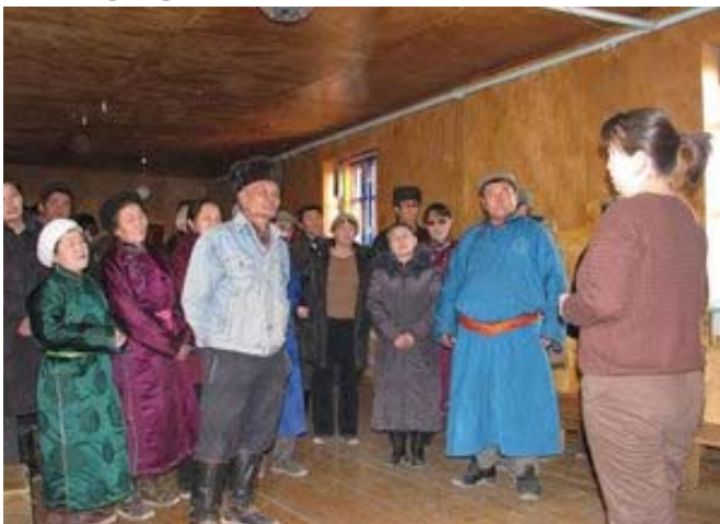
Ижтимоий сўровларда жамоа чўпонларининг иштироки.

2007 йил ноябрь ойида МАВА томонидан маблағ билан таъминланаётган сайгоқ бўйича WWF-Муғулистон янги йирик лойиҳаси бошланди. Мониторинг олиб бориш мақсадида, инспекторлар ва маҳаллий аҳолини ўқитишни, овчилик қоидалари бўйича мавжуд бўлган қонунчиликка тузатишлар тайёрлашда ҳукуматни жалб этишни ҳисобга олганда, у маълум натижаларга эришди.